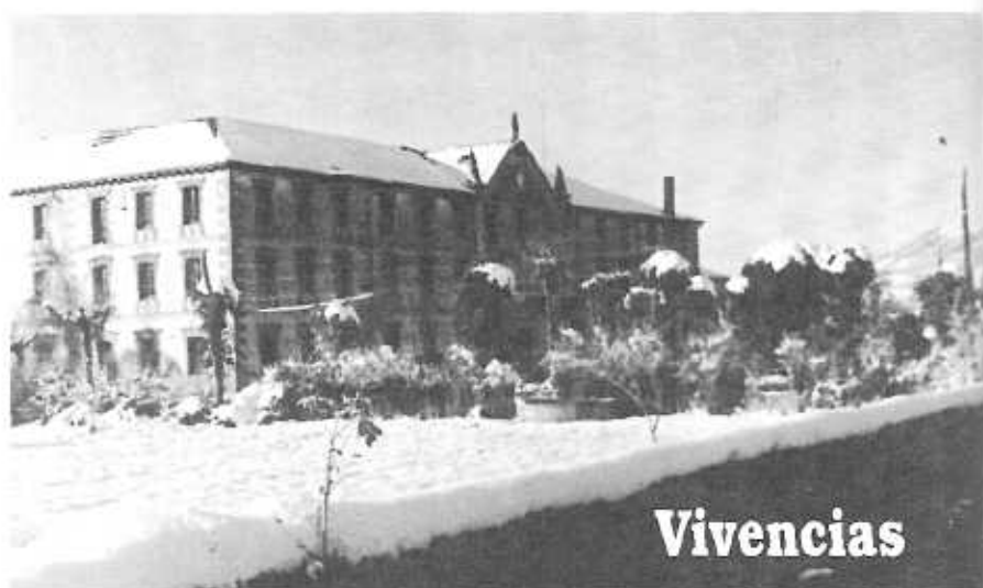
Apostólica de Murguía (Alava)