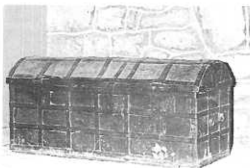
Arqueta o baúl antiguo donde estuvo guardado en un tiempo el inapreciable poema "Mío Cid".

El convento posee la arqueta o baúl donde estuvo guardado en algún tiempo el poema del "Mío Cid"