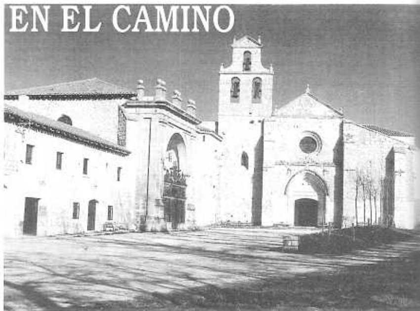
SANTUARIO DE SAN JUAN DE ORTEGA: Casa Rectoral, Capilla de San Nicolás y Templo Monacal.

Una vida dedicada al peregrino. Nuestro hospitalero, famoso en todo el mundo por sus sopas de ajo.