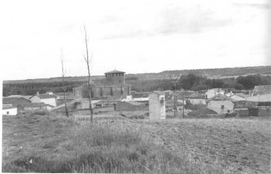
Zarzosa de Río Pisuerga