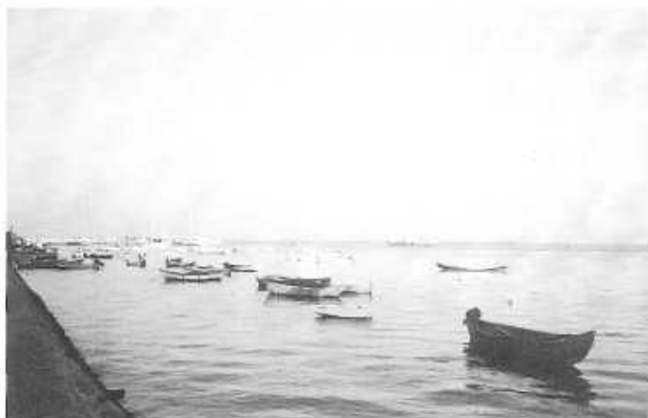
"Castilla la Vieja: ¡El mar, el mar... Y ponerse el sol (Azorín)