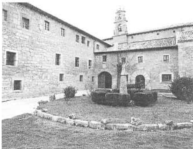
Entrada al Monasterio de Santa Clara

El 21 de septiembre de 1620 un voraz incendio abrasó todo el convento, excepto una pequeña porción de la Iglesia y Capilla de María Santísima con la imagen de Nuestra Señora del Espino. Las monjas fueron llevadas algunos días a una casa inmediata y luego trasladadas a Burgos durante dos años,