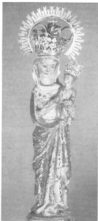
Nuestra Señora del Espino. Monasterio de HH. Clarisas

El año 1977 se celebró solemnemente el V Centenario de la fundación del Monasterio y el MC de la fundación de Burgos. Para conmemorar los dos acontecimientos el Ayuntamiento de Burgos acuñó la medalla conmemorativa y editó un facsimil del poema de "Mío Cid", entregando una copia al Monasterio en el mes de Abril. Del 7/6/1987 a 15/8/1988 se celebró el Año Jubilar Mariano.